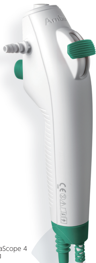
Ambu aScope 4 ブロンコ