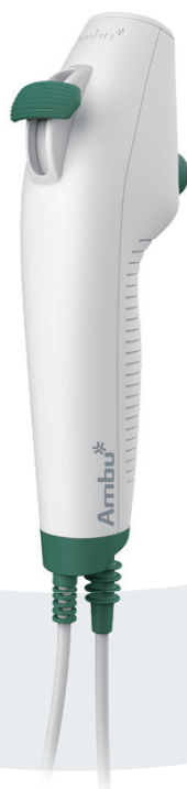
Ambu aScope 4 ブロンコ レギュラー 5.0/2.2