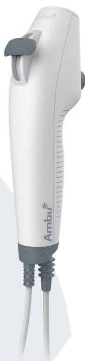
Ambu aScope 4 ブロンコ スリム 3.8/1.2